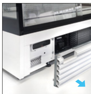
Fácil acesso frontal à unidade de condensação. Easy front access to the condensing unit for maintenance.