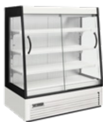
Mural refrigerado compacto H15 H15 refrigerated compact multideck