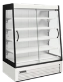
Mural refrigerado compacto H17 H17 refrigerated compact multideck